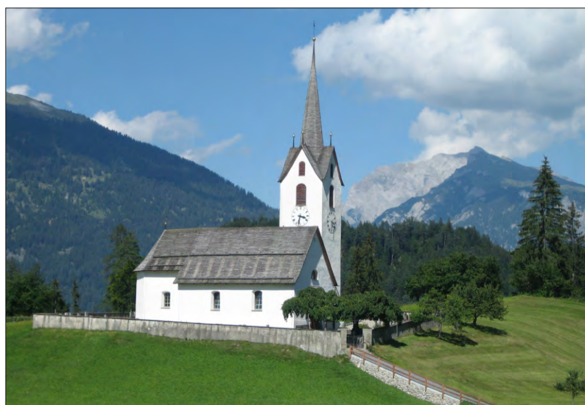
Baselgia reformada da Versomi.